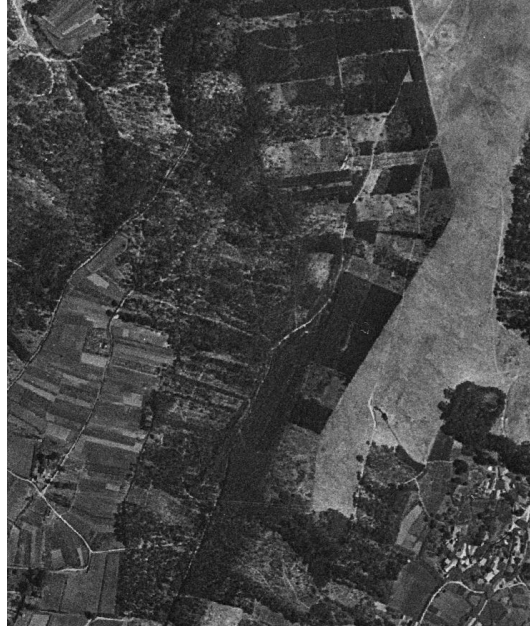
Fotograma con data de voo no 23/07/1956

O Centro Nacional de Información Xeográfica dispón dunha biblioteca de fotos antigas nas que se poden apreciar os camiños descritos en cor vermella tanto nos fotogramas de 1956 como de 2010.